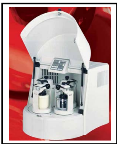
Pulverisette 5 : 4 posturi de lucru