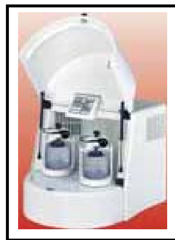
Pulverisette 5 : 2 posturi de lucru