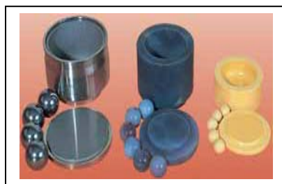
Pulverisette 5 : Incinte și bile de măcinare